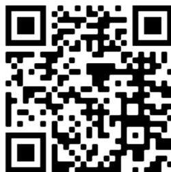
QR kód pro video návod